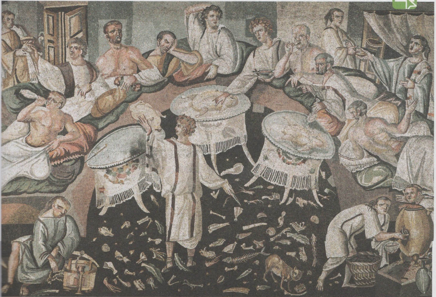
Mosaïque romaine d'une scène de banquet, env. 450 ap. J.-C., Neuchâtel (Suisse), musée du château de Boudry.